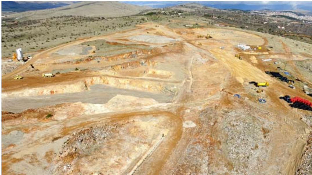
Εικ. 11: Άποψη του εργοταξίου κατασκευής της Πανεπιστημιούπολης Κοζάνης.