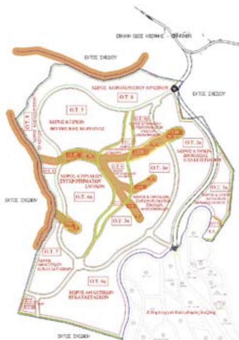
Εικ. 2: Το τοπικό ρυμοτομικό της Πανεπιστημιούπολης Κοζάνης, βόρεια της Ζ.Ε.Π.