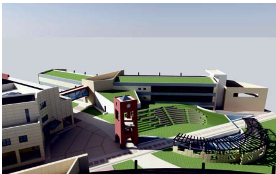
Εικ. 6: Τρισδιάστατη απεικόνιση της Α! Φάση ανάπτυξης των Σχολών της Πανεπιστημιούπολης Κοζάνης. (υπαίθριος διαμορφωμένος εξωτερικός χώρος μεταξύ των Σχολών)