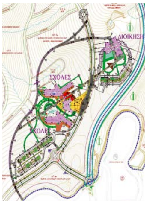
Εικ. 3: Α! Φάση ανάπτυξης της Πανεπιστημιούπολης Κοζάνης, βόρεια της Ζ.Ε.Π.

URL: www.anko.gr e-mail: tpadopoulos@anko.gr