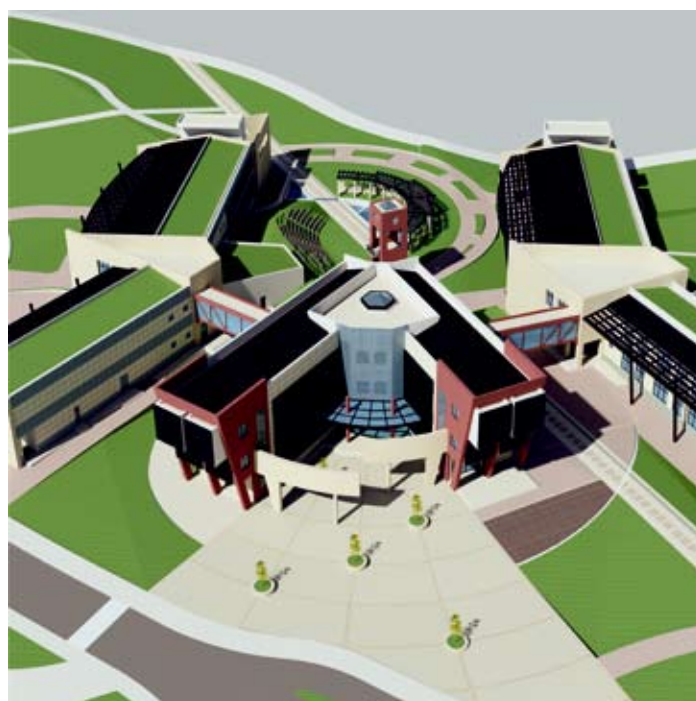
Εικ. 5: Τρισδιάστατη απεικόνιση της Α! Φάση ανάπτυξης των Σχολών της Πανεπιστημιούπολης Κοζάνης. (βιοκλιματικός σχεδιασμός κτιρίων)