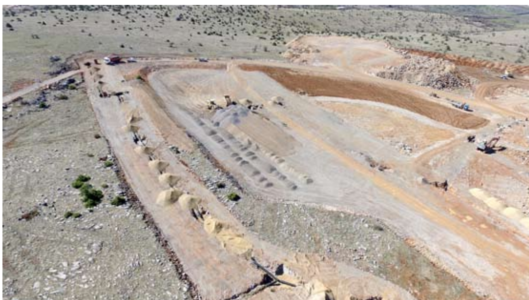
Εικ. 10: Άποψη του εργοταξίου κατασκευής της Πανεπιστημιούπολης Κοζάνης.