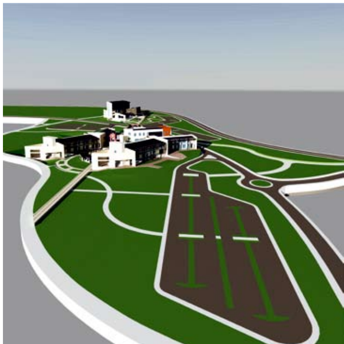
Εικ. 4: Τρισδιάστατη απεικόνιση της Α! Φάση ανάπτυξης της Πανεπιστημιούπολης Κοζάνης, βόρεια της Ζ.Ε.Π. (σε πρώτο πλάνο το συγκρότημα των Σχολών και στο βάθος το κτίριο της Διοίκησης του Πανεπιστημίου)