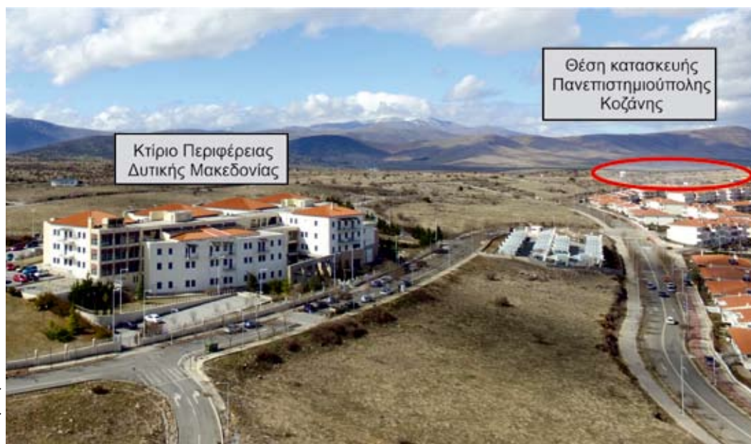
Εικ. 9: Γενική άποψη της θέσης κατασκευής της Πανεπιστημιούπολης Κοζάνης.

Παρούσα κατάσταση: Το έργο βρίσκεται σε εξέλιξη.