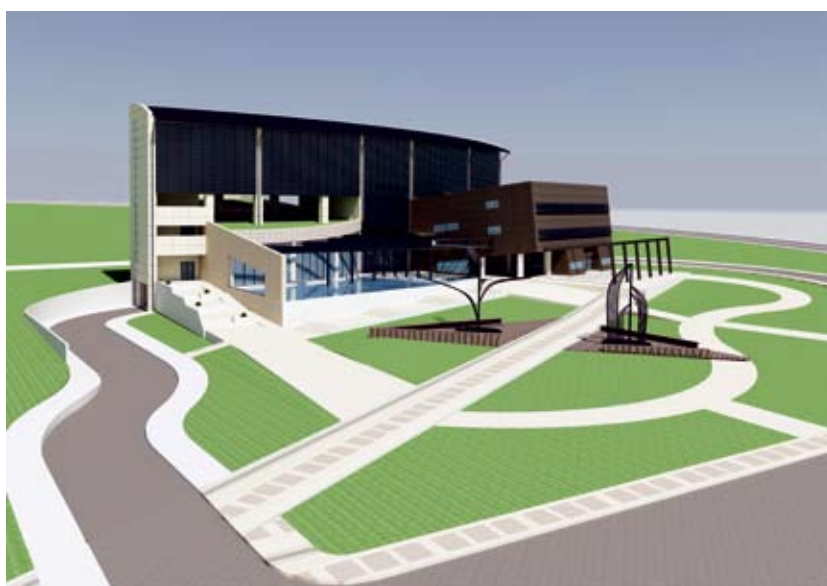
Εικ. 7: Τρισδιάστατη απεικόνιση της Α! Φάση ανάπτυξης του κτιρίου Διοίκησης της Πανεπιστημιούπολης Κοζάνης. (βιοκλιματικός σχεδιασμός)