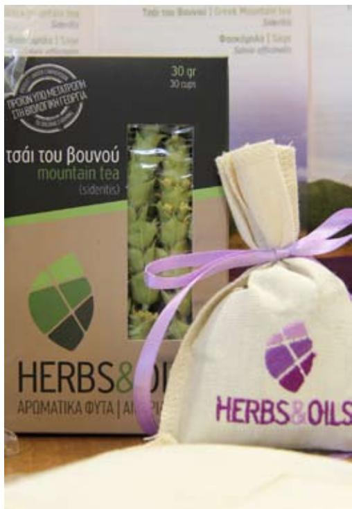
Μαλίνης Νικόλαος: Ίδρυση μονάδας απόσταξης αρωματικών - φαρμακευτικών φυτών

καινοτόμες και ανταγωνιστικές επιχειρήσεις.